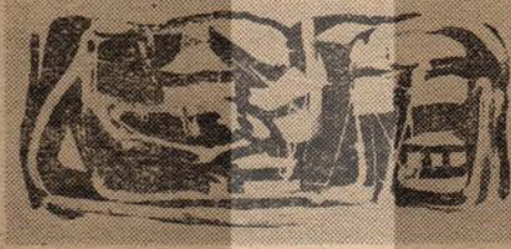
Desen : Kaya ÖZSEZGİN

de «romantiklerin hayal ettikleri gibi eşyasız ben» dir. Hem eşyaları, hem de insanı, evrensel bir bütünlük içinde vermeğe çalışan çağdaş resmi, o tutuma paralel, o tutumu haklı çıkaran bir gerçekçilik açısından yorumlamanın gereğidir bu.. Garaudy, yer yer, kitabında bu gereğin sorumluna değiniyor. Bu sorum, Picasso'yu, yaşayan ressamı içinde «mythe» olma durumundan kurtarmak, onu, kurgusal birtakım yorum-